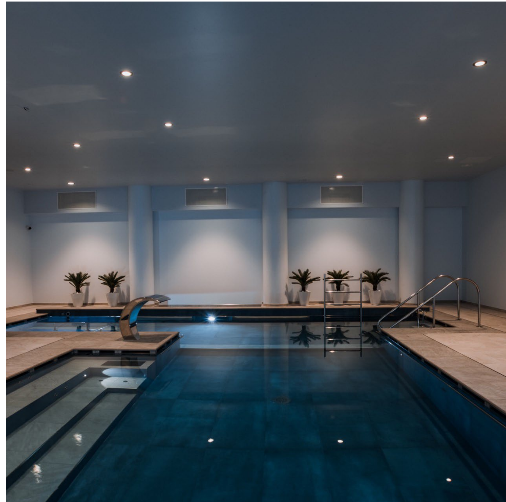
Piscina coperta a 31° C con idromassaggio e nuoto controcorrente, zona relax.