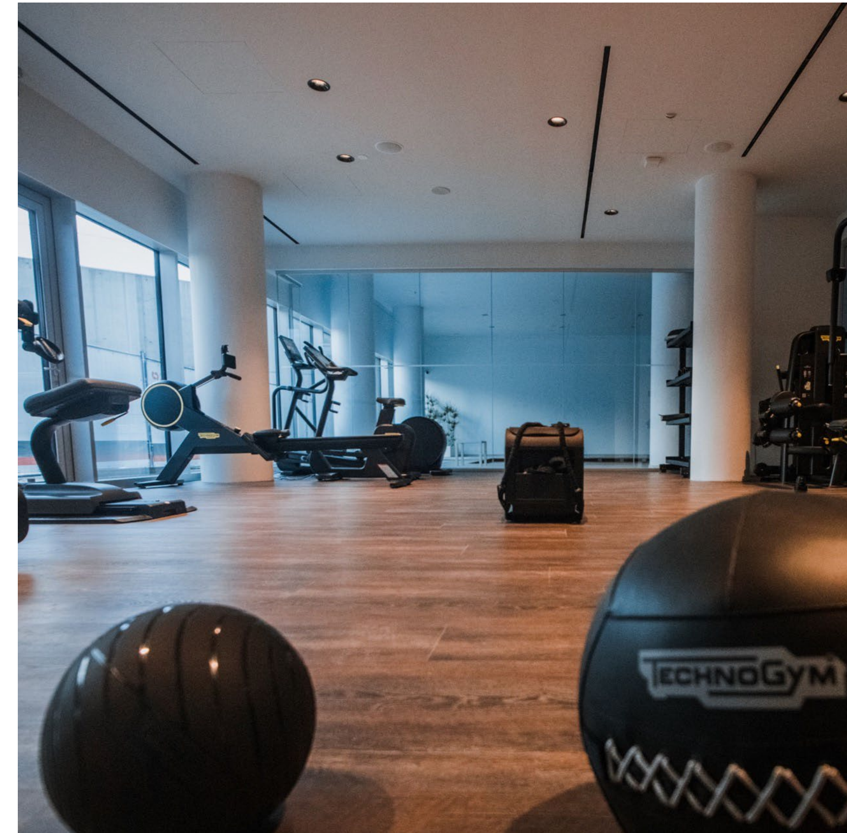
Palestra allestita con dispositivi, apparecchiature ed attrezzi Technogym.