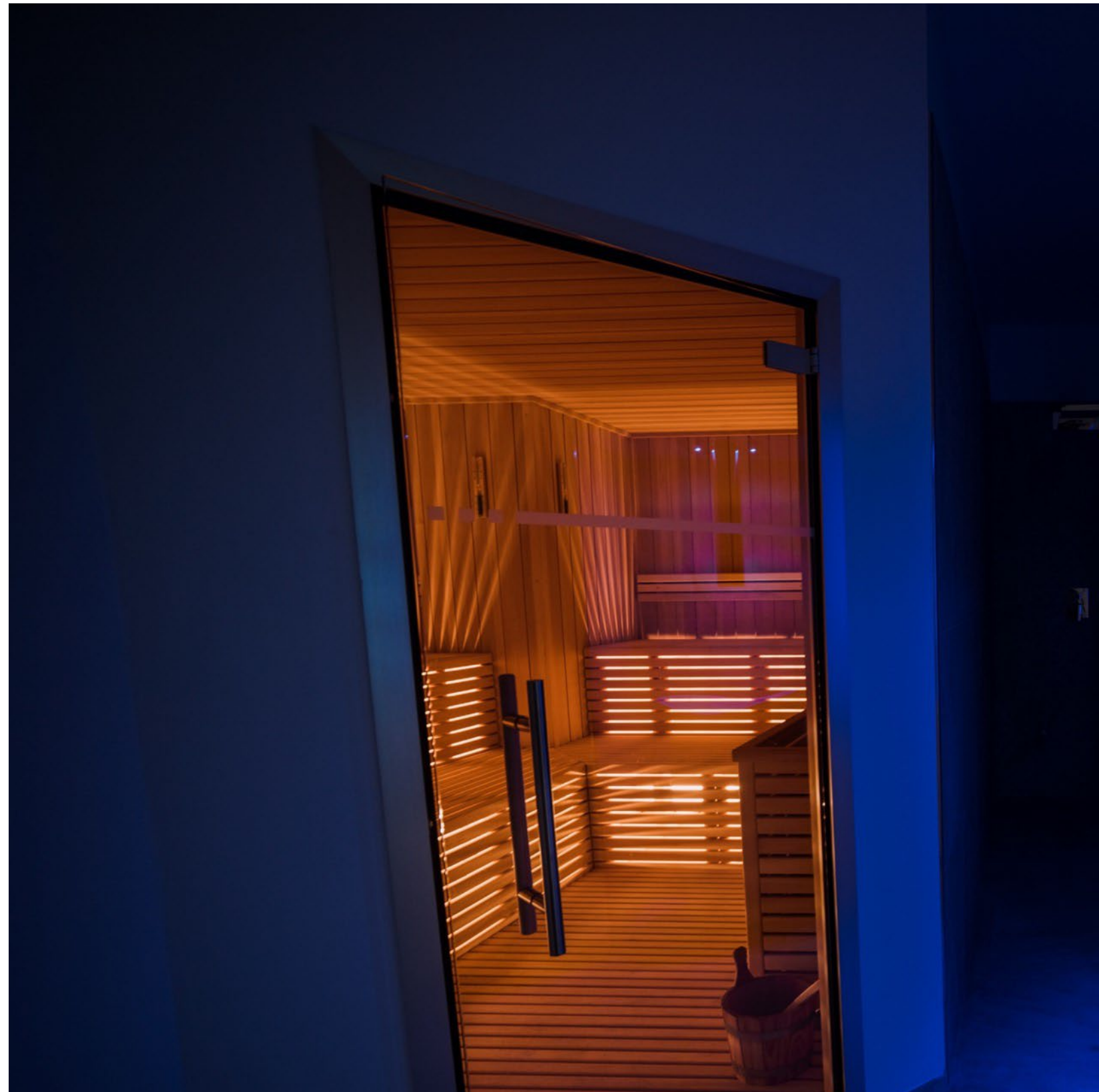
Sauna Finlandese, Bagno turco, fontana di ghiaccio e cabine trattamenti