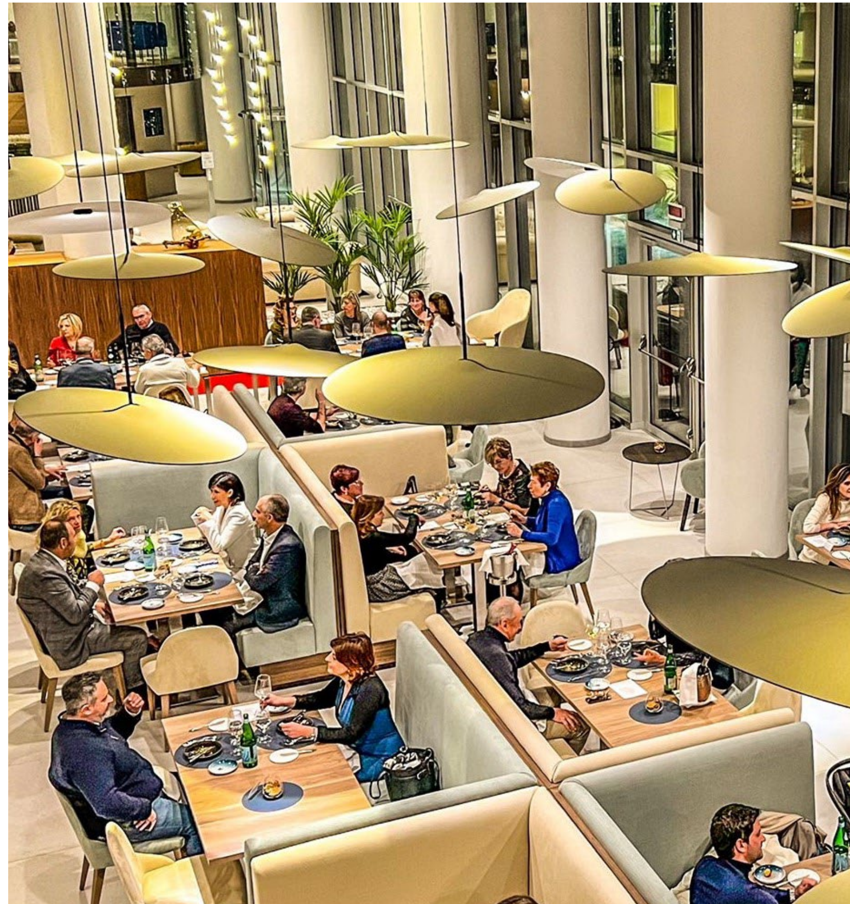
Le Terre Gourmet